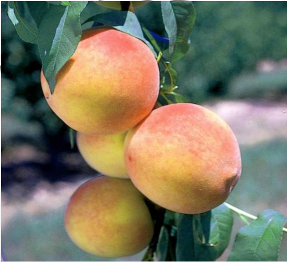
ПЕРСИК "ПУШИСТЫЙ РАННИЙ"