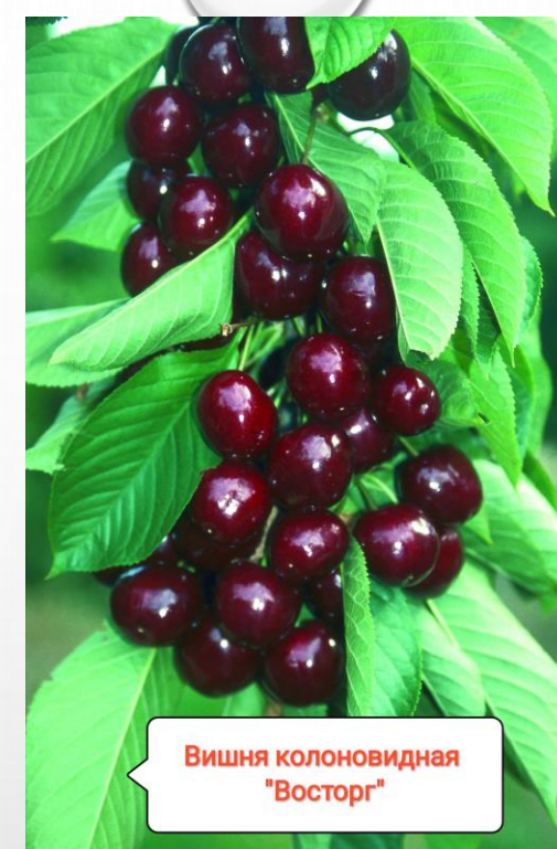
Вишня колоновидная "Восторг"

ОТЛИЧИТЕЛЬНОЙ ЧЕРТОЙ И ДОСТОИНСТВОМ ЧЕРЕШНИ САБРИНА ЯВЛЯЕТСЯ ЕЕ САМОПЛОДНОСТЬ. ПЛОДЫ ДАННОГО СОРТА ИМЕЮТ НАСЫЩЕННЫЙ СЛАДКИЙ ВКУС И ДОВОЛЬНО БОЛЬШИЕ ПО РАЗМЕРУ ЯГОДЫ.