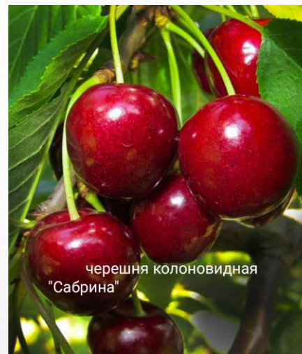
черешня колоновидная "Сабрина"

СПЕЛЫЕ ЯГОДЫ ТЁМНО-КРАСНОГО ЦВЕТА С БЛЕСТЯЩЕЙ КОЖУРОЙ. ПЛОТНОСТЬ ПЛОДОВ СРЕДНЯЯ. МЯКОТЬ НАСЫЩЕННО-КРАСНОГО ЦВЕТА, ХРУСТЯЩАЯ, СОЧНАЯ. ВКУС У НЕЁ ОТМЕННЫЙ, ЯРКИЙ.