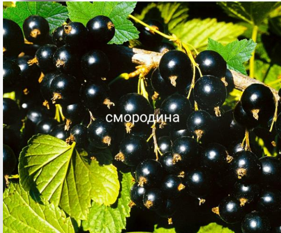
СМОРОДИНА ЧЕРНАЯ «ТАМЕРЛАН»

— СРЕДНЕГО СРОКА СОЗРЕВАНИЯ, УНИВЕРСАЛЬНОГО НАЗНАЧЕНИЯ. КУСТ ВЫСОКОРОСЛЫЙ, СРЕДНЕРАСКИДИСТЫЙ. КИСТИ СРЕДНЕЙ ДЛИНЫ, 5–7 СМ. ЯГОДЫ КРУПНЫЕ, 1,4–1,6 Г, ОКРУГЛЫЕ, НЕОДНОМЕРНЫЕ, ЧЕРНЫЕ, СО СРЕДНИМ КОЛИЧЕСТВОМ СЕМЯН ЯЙЦЕВИДНОЙ ФОРМЫ, ВКУС КИСЛО–СЛАДКИЙ (4,6 БАЛЛА), НАЗНАЧЕНИЕ УНИВЕРСАЛЬНОЕ. СОРТ СКОРОПЛОДНЫЙ, ПРИГОДЕН ДЛЯ МЕХАНИЗИРОВАННОЙ ТЕХНОЛОГИИ ВОЗДЕЛЫВАНИЯ, СРЕДНЯЯ УРОЖАЙНОСТЬ 12,9 Т/ГА (3,9 КГ/КУСТ).